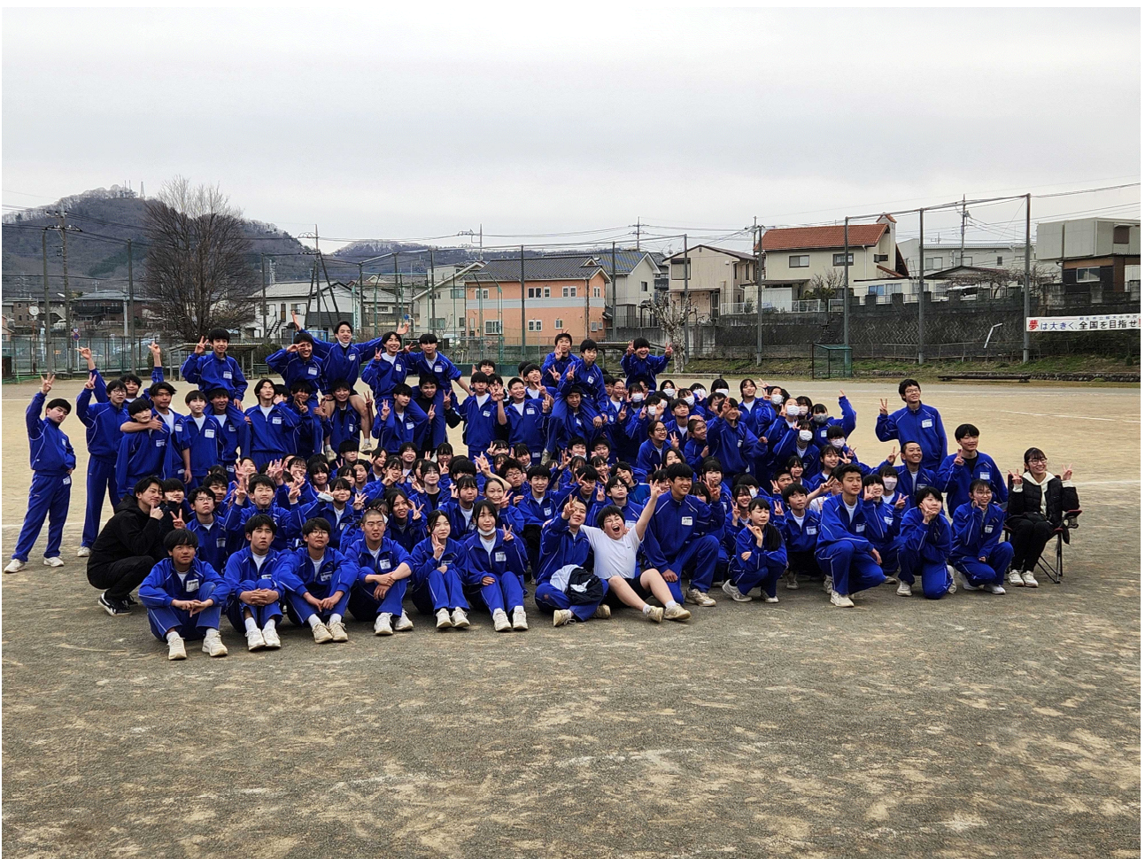
<最後にみんなで・・・>